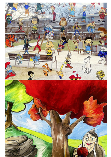
Créations des enfants du parascolaire. CORINNE SUDAN