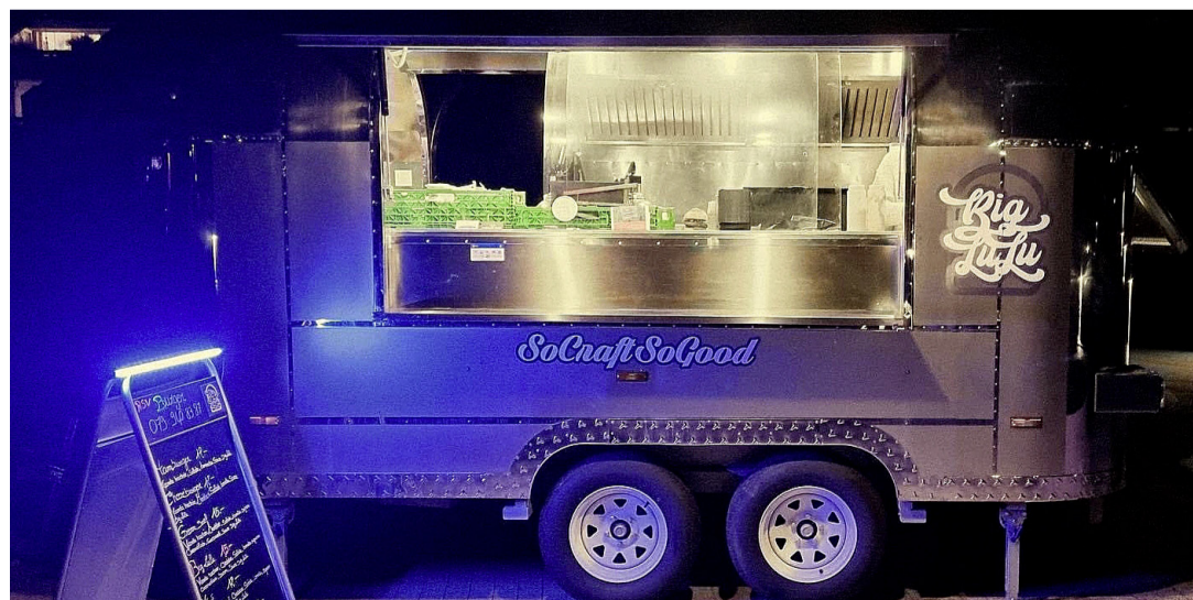
De délicieux burgers à Cologny. Ça y est! Il est arrivé au Centre sportif de Cologny. Qui donc? Big Lulu, le food truck de Cologny. En effet, Big Lulu Burgers vous sert désormais de copieux et variés burgers 100% suisses ainsi que des frites maison tous les jeudis et vendredis de 11 h à 14 h et de 18 h à 21 h. N'hésitez pas à téléphoner pour réserver vos burgers à l'avance, au 079 940 83 87. BIG LULU BURGERS