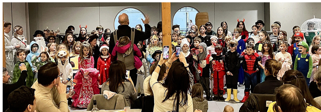
Les enfants chantent l'Escalade pour la plus grande joie de l'assistance. OLIVIER LOMBARD

La soirée s'est poursuivie avec une verrée proposée par l'Association des parents d'élèves (APECH), ainsi qu'une délicieuse soupe aux légumes et la marmite en chocolat, toutes deux offertes par la mairie. Olivier Lombard