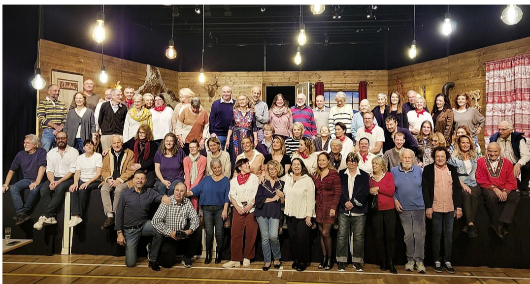
Photo de la grande famille du Groupe théâtral d'Hermance. GTH