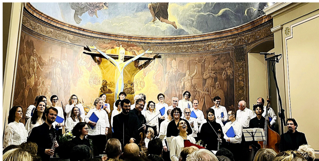
Le chœur Coherence en concert à l'église de Corsier le 16 décembre 2023. PATRICK JEAN BAPTISTE

Un bravo mérité donc au chœur, aux solistes et aux musiciens.