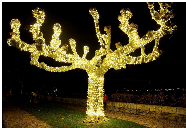
Illumination du quai. ANDREA ALIOTTI

Bravo à tous ceux qui se sont donnés sans compter pour nous offrir ces beaux moments de partage. Denise Bernasconi