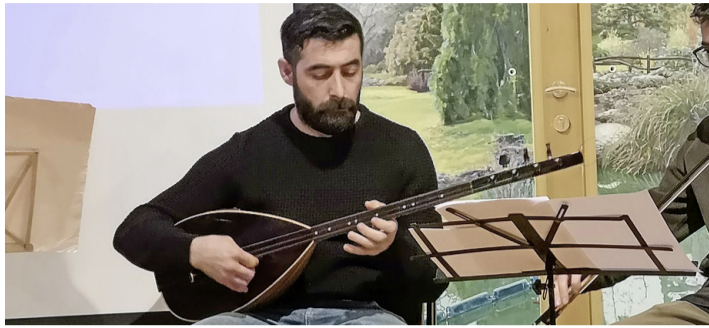
La réunion s'est terminée par de la musique traditionnelle kurde de l'ensemble «Sebahat Erdem VA» et de la nourriture traditionnelle préparée par des réfugiés vivant dans les communes de Genthod et Bellevue. TARA KERPELMAN PUIG

Pour faciliter l'intégration des demandeurs d'asile, Caritas aide à sensibiliser les habitants aux critères et aux démarches nécessaires pour accueillir des personnes réfugiées, pour leur trouver un endroit sûr et accueillant. L'année dernière, 511 personnes réfugiées ont été hébergées et accompagnées dans 315 foyers. Ces chiffres ne comptent que les personnes inscrites dans le programme de Caritas. Lors d'une séance d'information à Genthod, le 24 janvier, sur