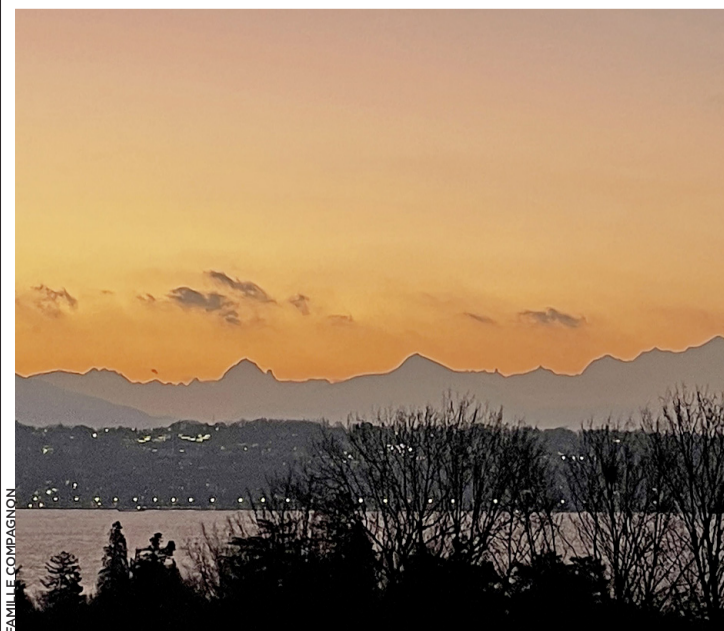
Lever du soleil depuis le banc de la route de Pregny.