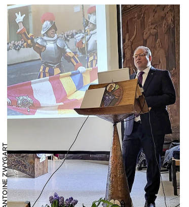
Lors de la conférence.