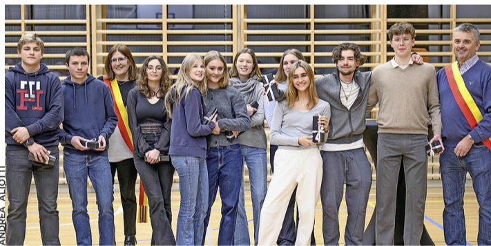
Les nouveaux citoyens ayant obtenu leur majorité civique.

En effet, ayant atteint leur majorité civique, ils ont été appelés à monter sur scène lors de l'apéritif communal en début d'année,