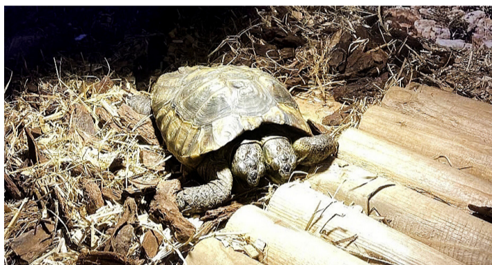
«Janus» dans son vivarium. CAROLINE DELALOYE

Pour pouvoir l'accueillir, une roulotte spécialement aménagée a été installée près de l'entrée du parc. Janus, un mâle de 26 ans, peut ainsi recevoir les soins qu-