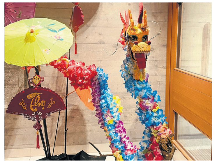
Le dragon de bois avec tout son panache. CORINNE SUDAN

Après une petite pause, une représentation des arts martiaux de la Fédération Vovinam Viet Vo Dao Suisse, accompagnée par le maître Tân Rousset et les enfants. Pour terminer, le public s'envola jusqu'au carnaval de Rio de Janeiro avec un show de samba, invitant ceux et celles qui le désiraient à se laisser aller dans la danse.