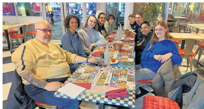
Nos jeunes attablés au bowling de Balexert.

Ils ont pu tout d'abord assister à une présentation de la commune et de ses principales caractéristiques, telles que: sa géographie, l'impact des organisations