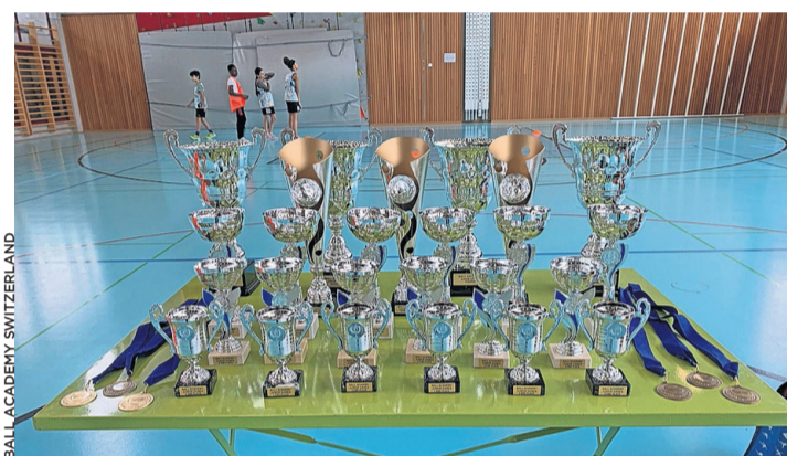
Inscrivez-vous jusqu'au 11 avril pour le Genthod 3x3.

Le basket 3x3 a des règles différentes du basket «classique», car on n'utilise que la moitié du terrain et un panier. Entre autres, les équipes sont composées de trois joueurs plus un remplaçant, les changements se font en cours de match, sans interruption, et la première équipe qui marque 21 points est gagnante, en sachant que le match dure au maximum dix minutes. Toutes les règles sont disponibles en français sur le site de